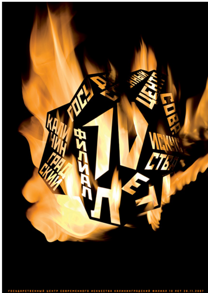
ГОСУДАРСТВЕННЫЙ ЦЕНТР СОВРЕМЕННОГО ИСКУССТВА КАЛИНИНГРАДСКИЙ ФИЛИАЛ 10 ЛЕТ 28.11.2007

Упаковать столь много букв в черную каменюку помогла большая любовь к русскому конструктивизму и десятки вариантов компоновки. А потом мы сделали логотип из металла с черным напылением и устроили в фотостудии настоящее файер-шоу. Почти триста кадров с горящими буквами позволили создать экспрессивный образ «пыляющих 10-лет», который был отмечен серебряной медалью Варшавской биеннале плаката в 2008 году.